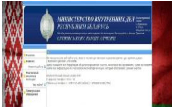
Рис. 3. Проект веб-сайта участкового инспектора милиции (главная страница)

Для формирования такого общения участковым инспекторам милиции можно предложить вести районный веб-сайт участкового инспектора милиции для связи с населением. На веб-сайте участкового инспектора милиции появится возможность вести профилактическую работу с узким кругом лиц, отвечать на вопросы граждан онлайн, размещать объявления о наиболее важных событиях района. Создание веб-сайта участкового инспектора милиции поможет как в профилактической работе участкового инспектора милиции, так и благоприятно скажется на отношении общества к милиции в целом. Нами был разработан проект веб-сайта участкового инспектора милиции. На рис. 3 представлена главная страница веб-сайта.