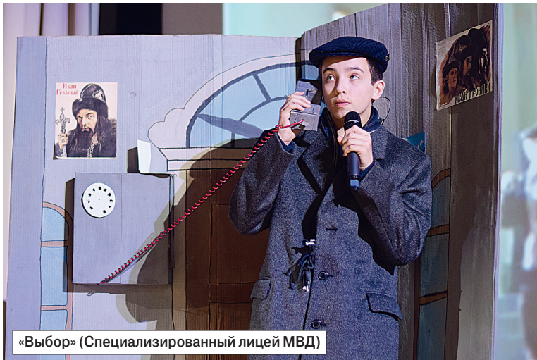
«Выбор» (Специализированный лицей МВД)

Кобринчане выбрали для постановки повесть Павла Нилина «Жестокость», кадеты из Минской области - произведе-