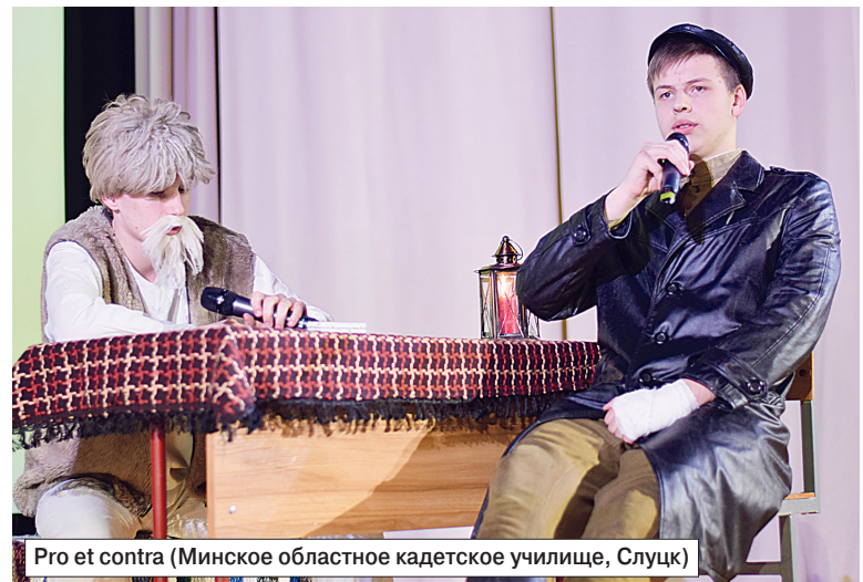
Pro et contra (Минское областное кадетское училище, Слуцк)

Представление команд прошло под непрерывающиеся овации болельщиков. Забегая вперед, отметим, что на протяжении всего конкурса каждая дружина ощущала горячую поддержку своих поклонников. Одни скандировали речевки, дру-