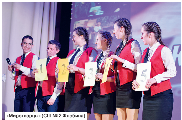
«Миротворцы» (СШ № 2 Жлобина)