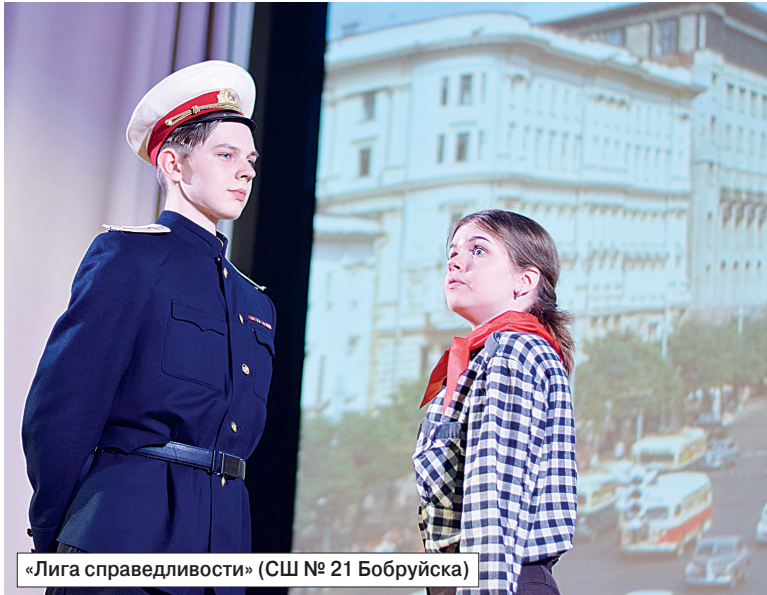
«Лига справедливости» (СШ № 21 Бобруйска)

очков. На полбалла меньше поработали коллективы из Минской области и Кобриня.