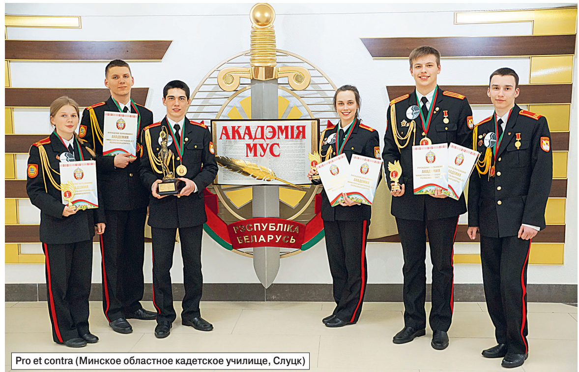
Pro et contra (Минское областное кадетское училище, Слуцк)

- Поступал в это учебное заведение, когда оно еще было кадетским училищем, - объяснил парень. - Поначалу, конечно, было непросто привыкнуть к жизни вне дома, но постепенно освоился, появились друзья. Сейчас даже не представляю, как можно жить без четкого распорядка дня, строгой дисциплины. По себе вижу, что благодаря пребыванию в стенах лицея стал более самостоятельным. Налегаю на учебу, ведь высокий средний балл даст возможность стать